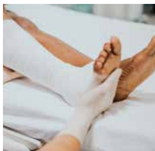
Kecacatan anggota badan kekal atau separa